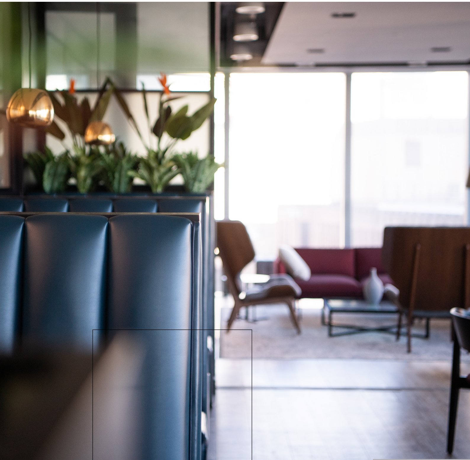
Zona de descanso de la oficina de Londres